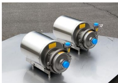
Robuste Pumpen aus Edelstahl gefertigt