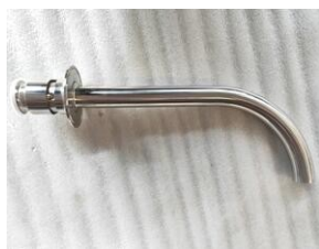
Schwenkbarrer Auslauf für hefefreies Bier