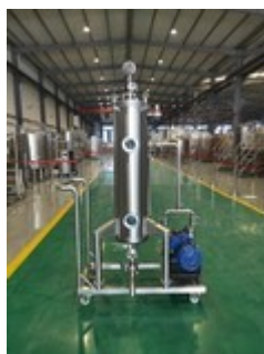
50lt Hop Gun fahrbar, mit Pumpe