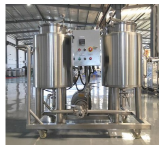
Kombigerät Pumpe und 2 Reinigungstanks mit 75, 100 oder 150lt