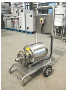
Nicht weg zu denkende Pumpe für die professionelle Reinigung von Tanks