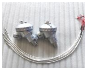
Thermofühler PT 100