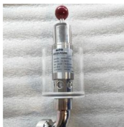
Spundapparat ohne Druckanzeige