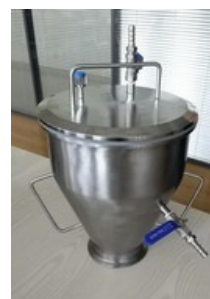
10lt Hop Port, als Aufsatz auf ZKT